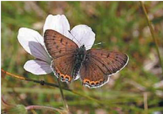
Hona av violett guldvinge.

Likaledes är det norrländska utmarkslandskapets vinterfodermarker i form av vattenreglerade ängar, myrslogar och raningar, som nu utesluts från stöd på grund av sin koppling till dagens skogsbegrepp, unika och utomordentligt skyddsvärda biotoper med mycket höga natur- och kulturvärden.