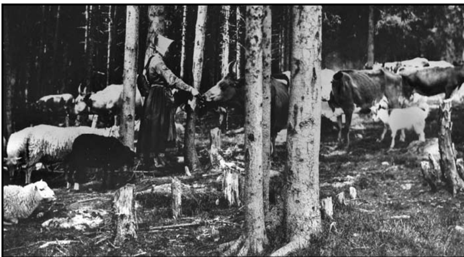
När kor, får och getter sambetar påverkas en mängd arter gynnsamt. Med vallhjon som styr djuren hindras utarmning. Bilden togs i början av 1900-talet av Gerda Söderlund och är från en aspdunge i Floda socken. Från Leksands lokalhistoriska arkiv. Ur avhandlingen Fäbodväsendet 1550–1920

Riksdagen beslutade vidare om begränsade möjligheter att ansöka om skydds jakt. Reglerna om rätt att döda rovdjur för att skydda tamdjur ändras inte.