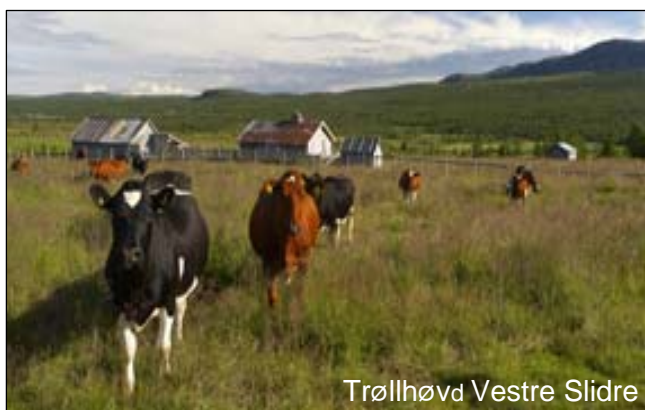
Trøllhøvd Vestre Slidre

Målgruppen är bönder, lantbruksförvaltningar, forskare och andra aktörer t. ex. Traktens hytteägare